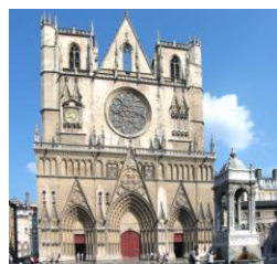
Cattedrale Saint-Jean Baptiste