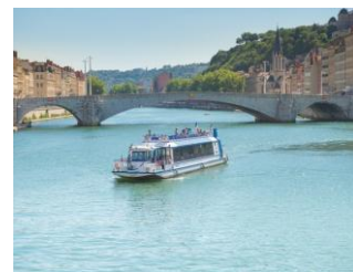
Crociera sulla Saone